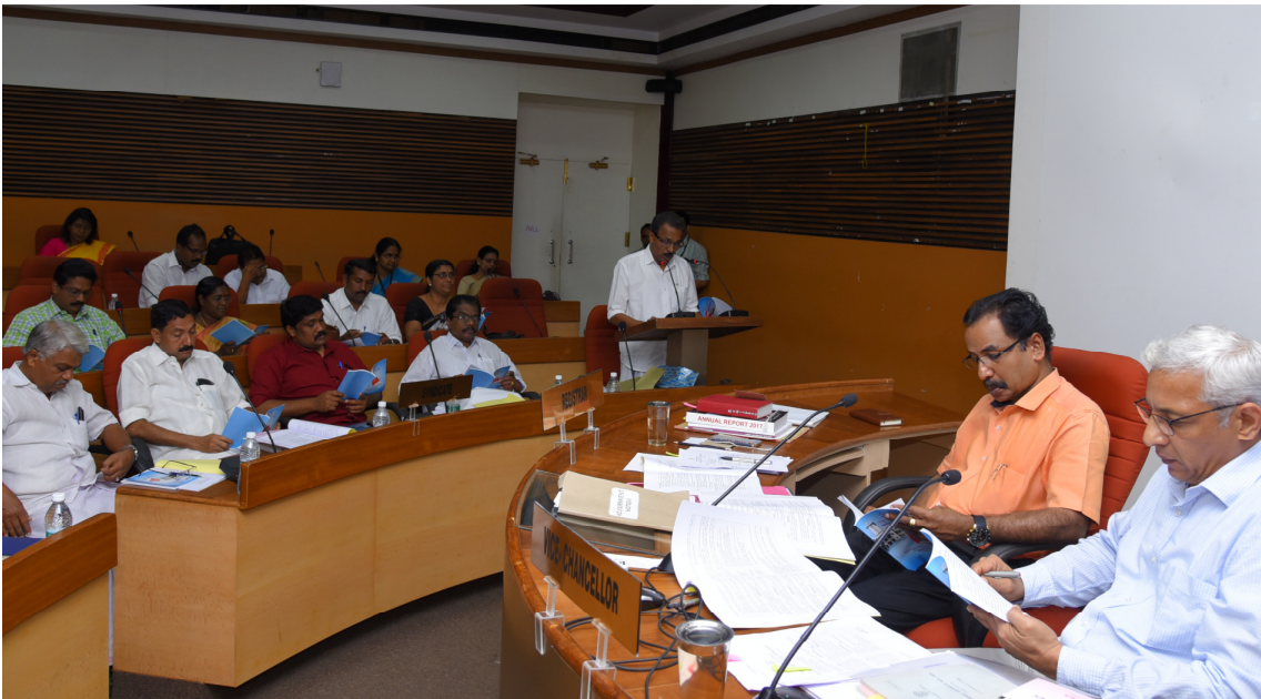
(ഫോട്ടോ ഇ-മെയിൽ ചെയ്തിട്ടുണ്ട്)

നാളെ വിശദമായ ചർച്ചകൾക്ക് ശേഷം ബഡ്ജറ്റ് സെനറ്റ് അംഗീകരിക്കും.